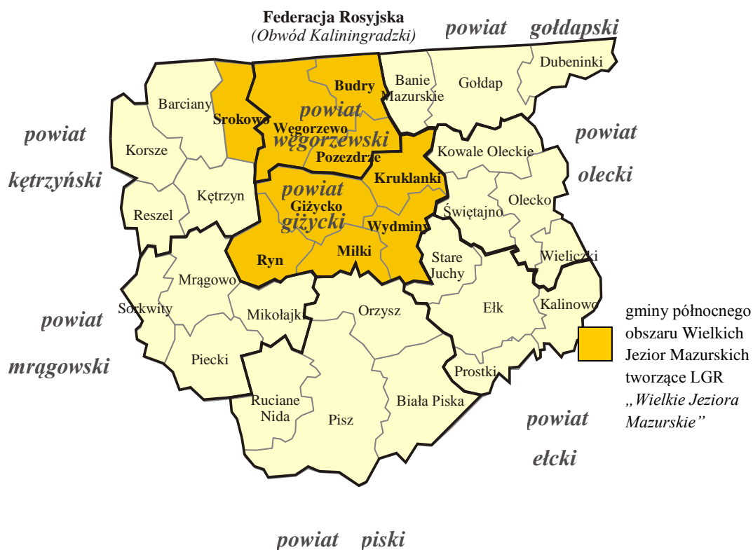
Rys. 2.1. Granice administracyjne gmin LGR „Wielkie Jeziora Mazurskie” oraz gmin z nimi sąsiadujących (stan na 31.12.2008 r.).

Źródło: Opracowanie własne na podstawie danych GUS.